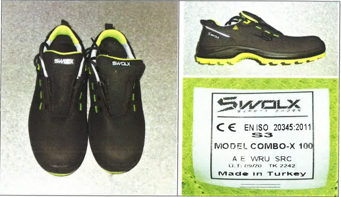
COMBO-X 100 model numunenin fotoğrafı