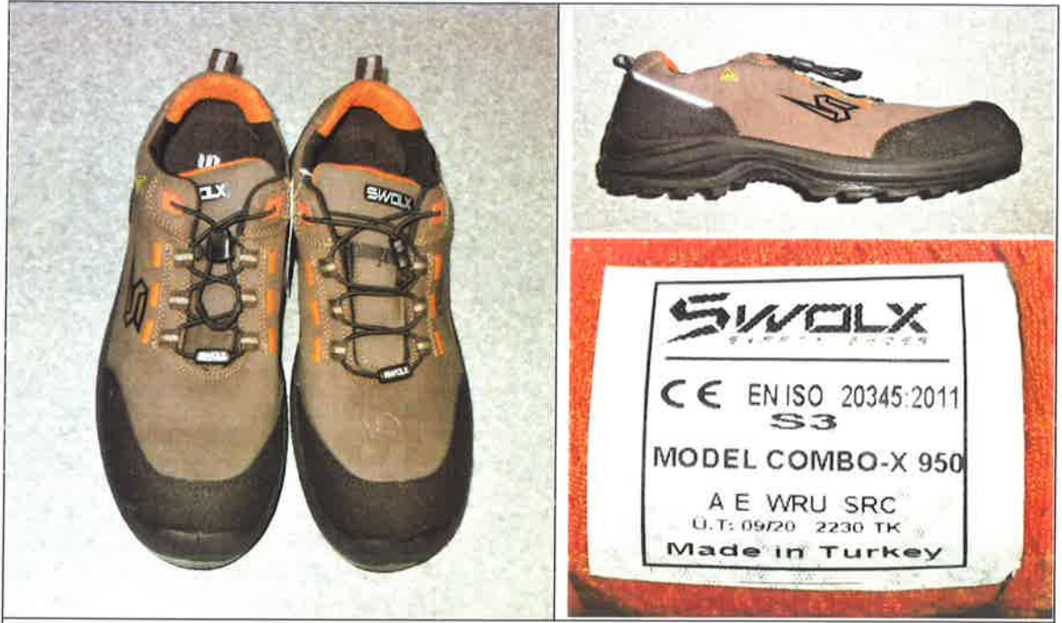
COMBO-X 950 model numunenin fotoğrafı