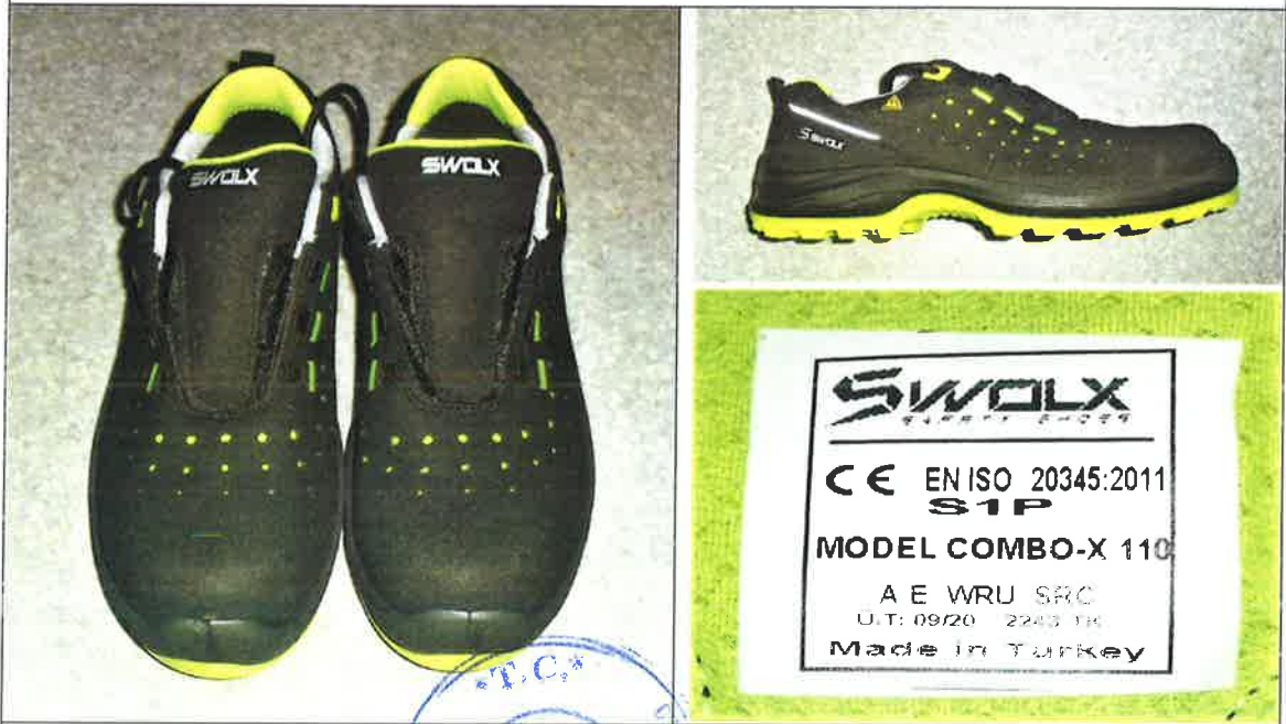
COMBO-X 110 model numunenin fotoğrafı